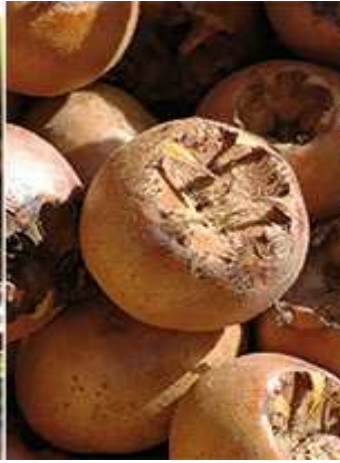
Les nespres (1)