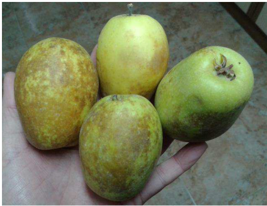
Els perellons (6)