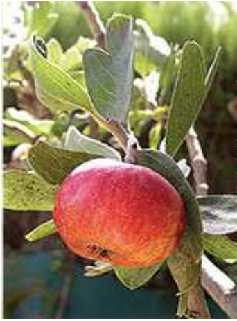
Les atzeroles (2)