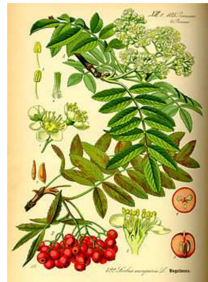
Serval dels caçadors (5)