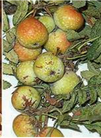
Les serves (3)