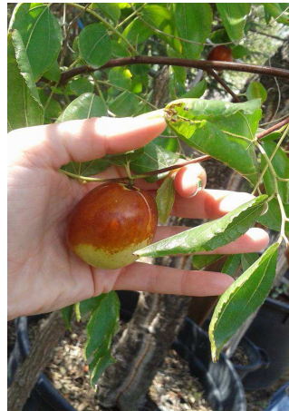
Els gíngols (7)