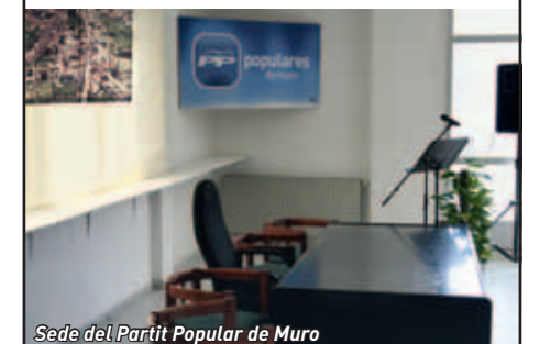
Sede del Partit Popular de Muro