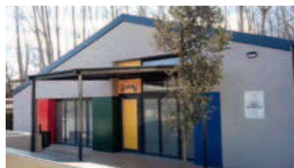
Façana del Centre

Amb l'ajuda del Pla Confiança de la Generalitat, Muro ha aconseguit rehabilitar l'antic escorxador de la localitat per reconvertir-lo en un espai d'oci per a joves. Es va inaugurar el novembre passat i està dirigit a adolescents de 15-16 anys. Aquest lloc compta amb diversos recursos com jocs de taula, consola de videojocs, projector, televisió, equip de música, taules, cadires i futbolí.