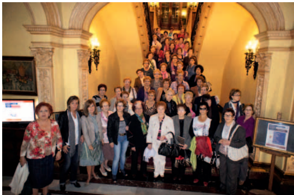
Las Amas de casa de Muro en el histórico Casino del siglo XIX de Castellón.